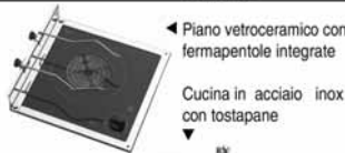
◀ Piano vetroceramico con fermapentole integrate