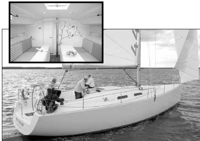
Il Varianta 44 (13,33 m) della Hanse è una nuova barca che punta sull'essenziale.

ce. L'albero, però, è un solido Sparcraft, la ruota del timone imponente (180 cm), ci sono quattro winch, il motore è un Volvo Saildrive da 40 hp e sotto la chiglia c'è un bel bulbo a "T".