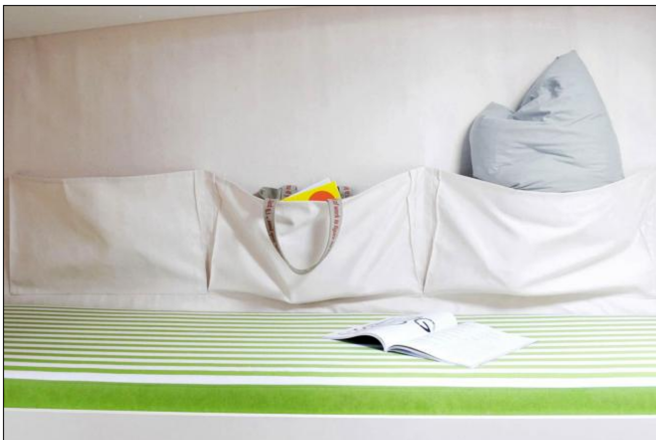
Le bordé du Varianta est habillé de toile avec équipets cousus, que l'on peut retirer pour l'hivernage. Malin, marin, ou les

M.S. : Les gens qui font de la croisière aujourd'hui utilisent très peu le mouillage et vont surtout dans les ports. Pas de baille à mouillage, ça permet de simplifier le bateau. Cela dit, on a quand même prévu un kit optionnel avec davier, guindeau et un accès par l'intérieur à un puits à chaîne pour ceux qui y tiennent vraiment.