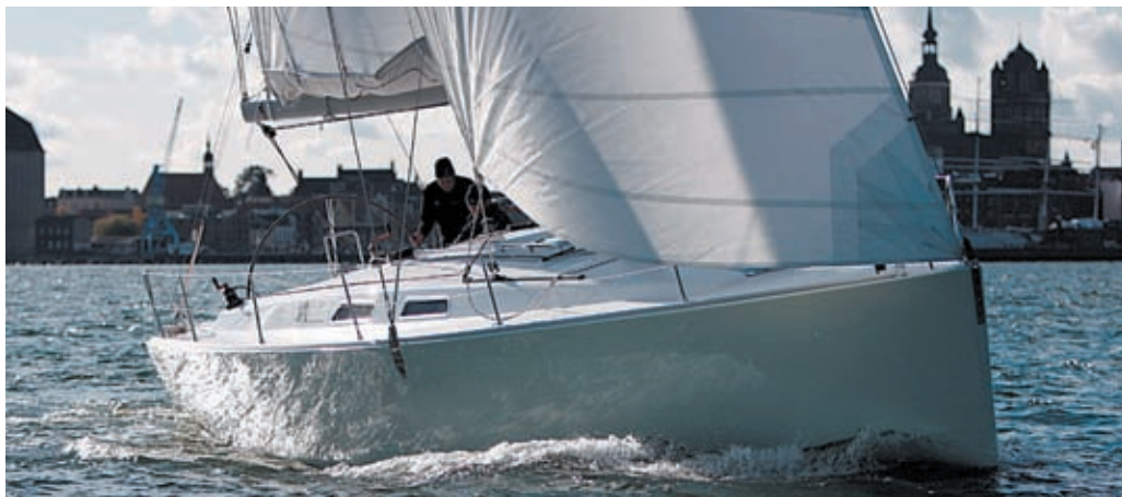
Der Traum einer grossen Yacht rückt in greifbare Nähe.