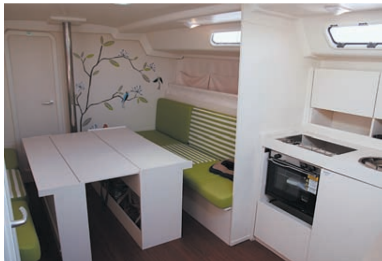
Heller und freundlicher Salon für acht Personen.

gen Polster. Man atmet förmlich auf, das Schiff ist Gebrauchsgegenstand und nicht Repräsentationsobjekt. Die Konstruktion ist solide, der Rumpf aus glasfaserverstärktem Kunststoff im Handauflegetechnikverfahren (Massivlaminat mit Stringern), hat eine eingeklebte Bodensektion, das Deck ist aus GfK-Sandwich. Wie bei allen Schiffen bei Hanse ist der Ruderschaft aus Aluminium, selbst ausrichtende Ruderlager reduzieren die Kräfte beim Steuern. Als Motor genügt ein 40-PS Diesel, jegliche Geräuschdämmung fehlt zugunsten des Preises, auch der Zugang unter dem Niedergang ist nicht ganz einfach. Im Achterschiff blieb die 44 ein wenig