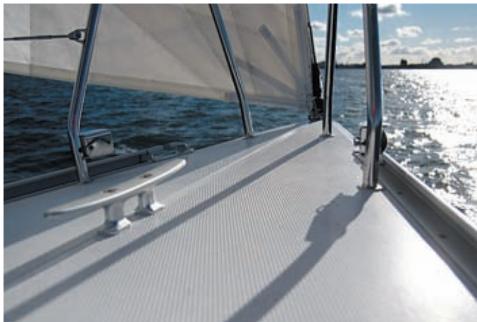
Schieres Vorschiff: Eine Mittelklampe reicht.

Von der Last befreit, auch eingerollt einigermaßen stehen zu müssen, hat die Fock ein ordentliches Profil bekommen, ebenso wie das Großsegel. Bei rund elf Knoten Wind laufen wir an der Kreuz fast sieben