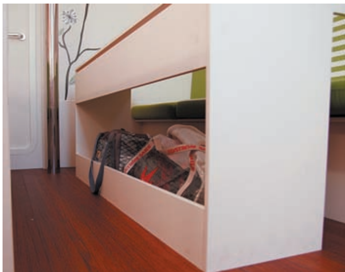
Salontisch mit Stauraum für drei Bierkästen.