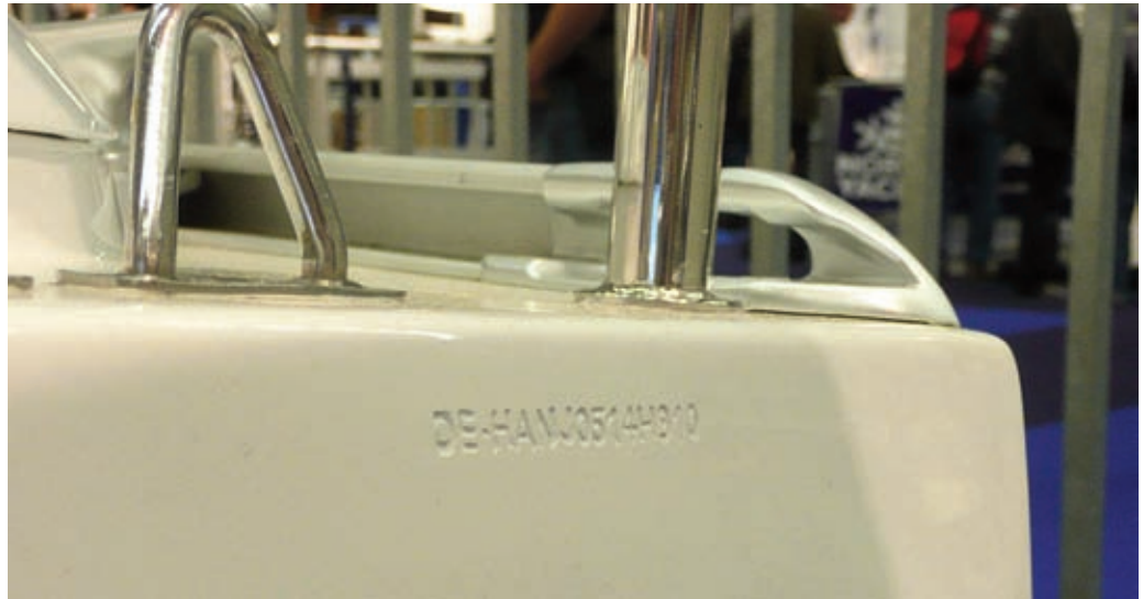
Jede Rumpfunternummer ist einmalig und dient der eindeutigen Identifizierung eines Wassersportfahrzeugs.

Die Rumpfunternummer ist in der Regel rechts am Spiegel des Wasserfahrzeugs angebracht – einlaminiert, geschweißt, genietet oder angeschraubt. Sie darf