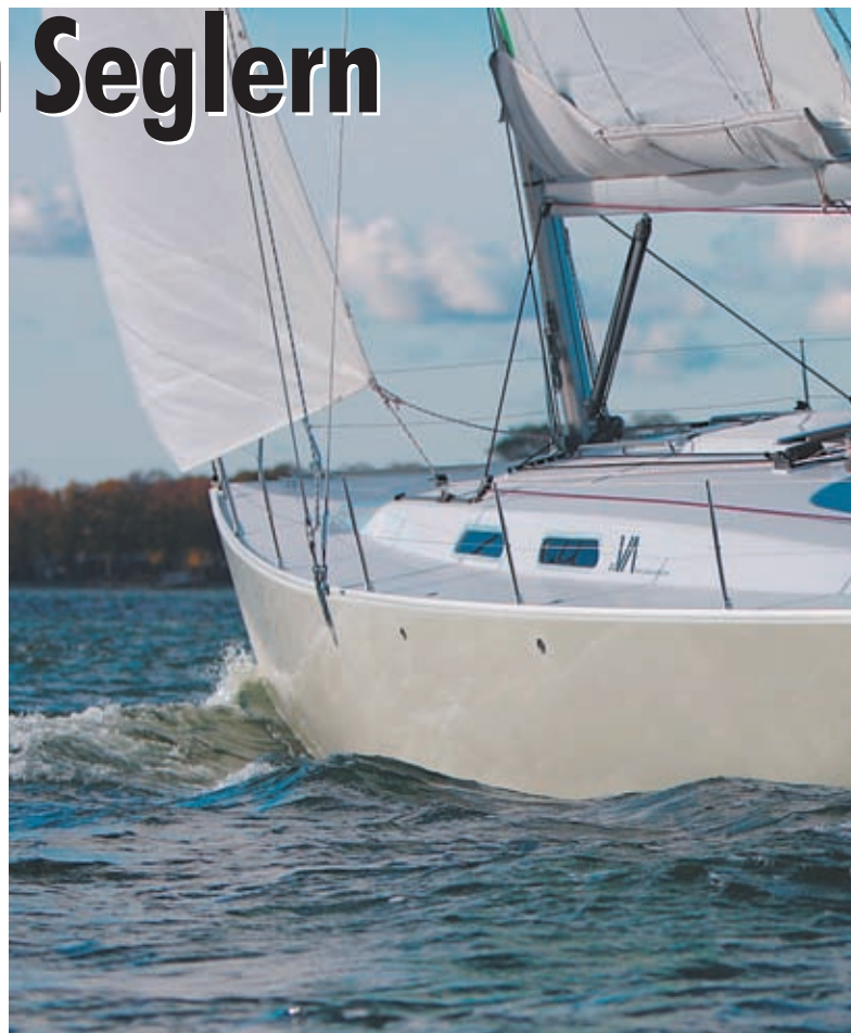
Varianta 44: 13 Meter Schiffslänge für 99.999 € – Viel Schiff für sehr wenig Geld.

Um die Seele des Geschenks geht es, es ist nicht der niedrige Preis, der die Varianta 44 so attraktiv macht, es ist die Message, die dahinter steckt: Für das Segeln an sich kann man auf alles Unwichtige verzichten, letztlich auch auf die klare Herkunft; aber auch auf jede Menge Ausrüstung, Extras und Luxusfeatures. Braucht man als Segler wirklich Rollfock, Ankerkasten, Elektro-Winden und – Winschen, ausgefeilte Elektrik und Elektronik, Bugstrahlruder oder Innenausstattungen, die so manche Wohnungen in den Schatten stellen? Nein, jedenfalls die Segler nicht, die einfach gern unterwegs sind, aber keine Großserienwerft dieser Welt hätte es sich je gewagt für diese Zielgruppe ein Schiff zu bauen – außer Hanse. Die Varianta 44