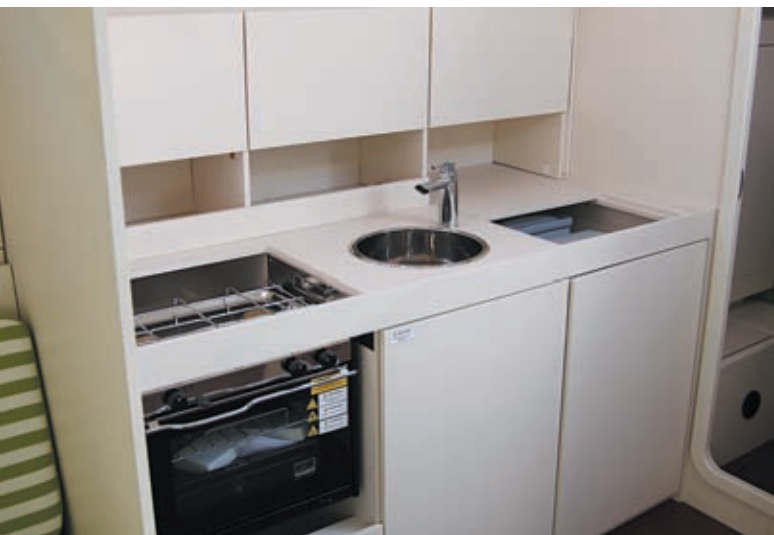
Pantry mit 2-Flam.-Herd, Spüle und Kühlboxen.