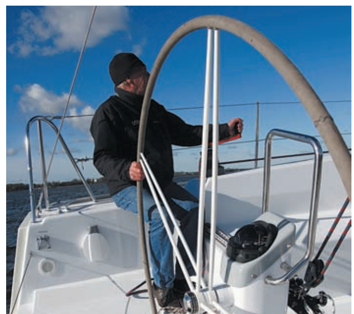
Ein Männertraum mit 1,80 Metern Durchmesser.

Die Varianta 44 ist ein Schiff für die Vollblutsegler, Heimwerker, Selbstausbauer und Low-Budget-Reisende auf Langfahrt, für die es in der Vergangenheit kaum noch Schiffe gab. Die voll ausgerüsteten Luxusyachten schossen für sie (auch was das Budget anging) über das Ziel hinaus, und genau diese Lücke könnte die Varianta 44 jetzt schließen. Sie ist das Statement für alle die sagen wollen: Ich brauch nicht mehr, ich kann das, danke. Wie das Naked Bike bei den Motorradfahrern, das ungefederte Mountainbike bei den Radlern – und das einfache Auto, auf das wir alle noch warten. Das unter Deck alles Weiß ist, ist eher eine Geschmacks- als eine Preisfrage; welches Furnier die Werft letztlich auf die Sperrholzplatten klebt, ist in der Herstellung vermutlich unerheblich. Ein modernes Schiff muss keine Mahagonischotten tragen, das entlastet ebenso wie die farbi-