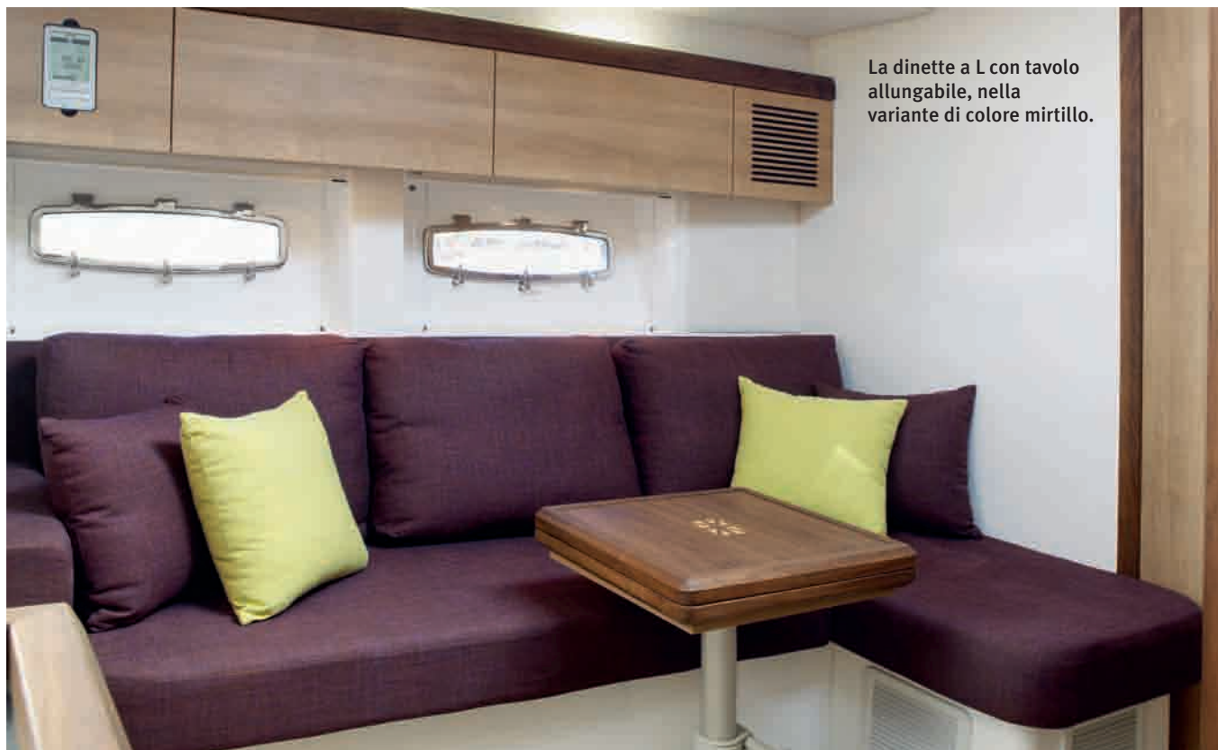
La dinette a L con tavolo allungabile, nella variante di colore mirtillo.