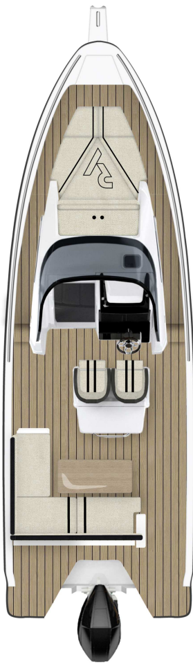
OPTION Tisch, Wetbar, Sitzbank & Bug gepolstert