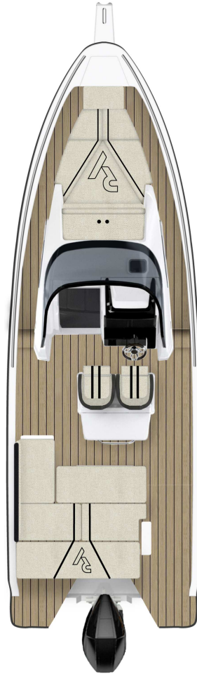
OPTION Sitzbank mit umklappbarer Rückenlehne, Wetbar