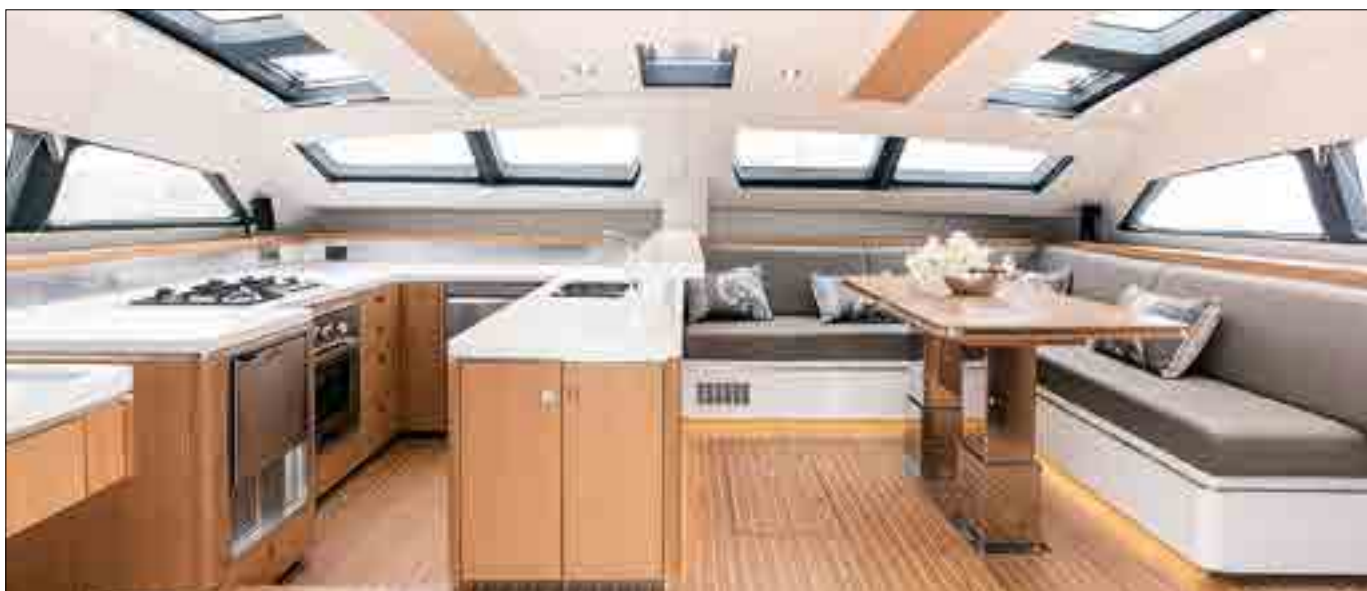
Le carré du Privilège S 5 propose un grand espace de vie tout en garantissant luminosité, vue panoramique sur l'extérieur et multiples rangements.

1,30 x 0,75 m : Les dimensions de la table du carré.