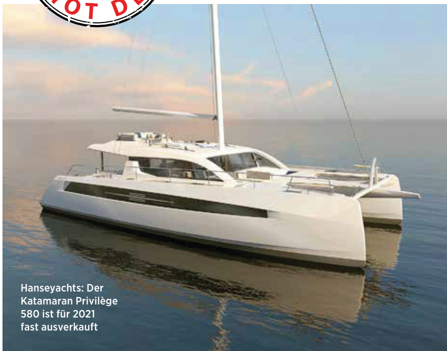
Hanseyachts: Der Katamaran Privilège 580 ist für 2021 fast ausverkauft

In dieser Rubrik stellt BÖRSE ONLINE heiße Spezialwerte für spekulative Anleger vor. Da hohen Kurschancen in der Regel hohe Risiken gegenüberstehen, sollten Kaufaufträge limitiert und Stoppkurse beachtet werden.