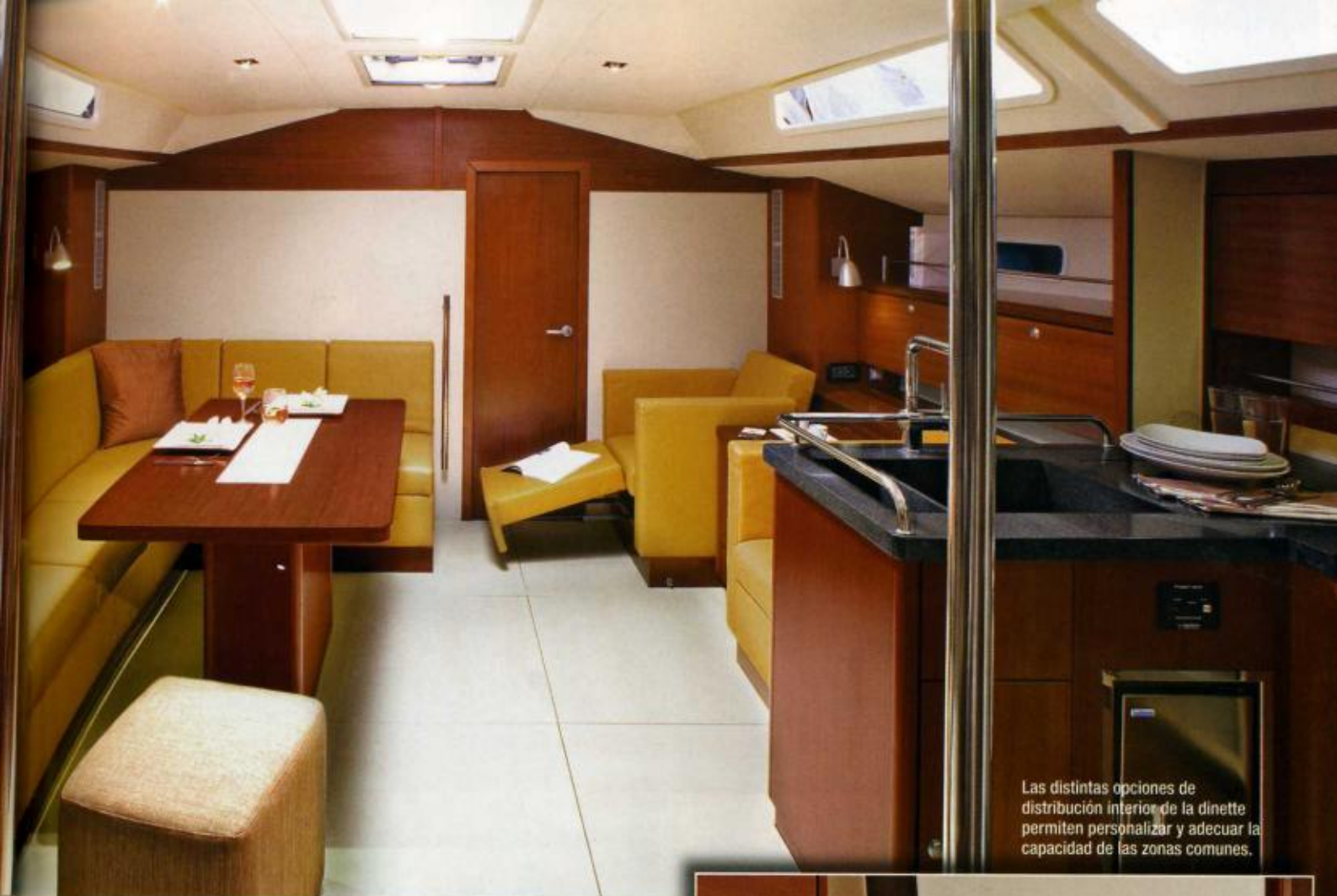
Las distintas opciones de distribución interior de la dinette permiten personalizar y adecuar la capacidad de las zonas comunes.

un problema resuelto desde el astillero, algo poco usual en esta eslora. Demás, toda la cubierta está forrada en teca como estándar, acentuando así la calidez y el confort en un espacio libre de obstáculos, en el que todos los elementos aparecen escamoteados y las escotillas enrasadas para evitar tropiezos o enganches con las velas.