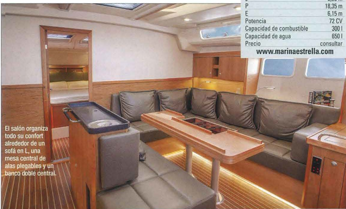
El salón organiza todo su confort alrededor de un sofá en L, una mesa central de alas plegables y un banco doble central.

Las líneas de cubierta renovadas contribuyen a incrementar la habitabilidad interior a la hora que subrayan la elegancia del diseño, rematada por el empleo de gran cantidad de portillos, ventanas y escotillas enrasadas. Éstos, además, garantizarán luz y ventilación a unos interiores a los que se accede confortablemente gracias a la escalera situada a 54° que ya encontrábamos a bordo del Hanse 575.