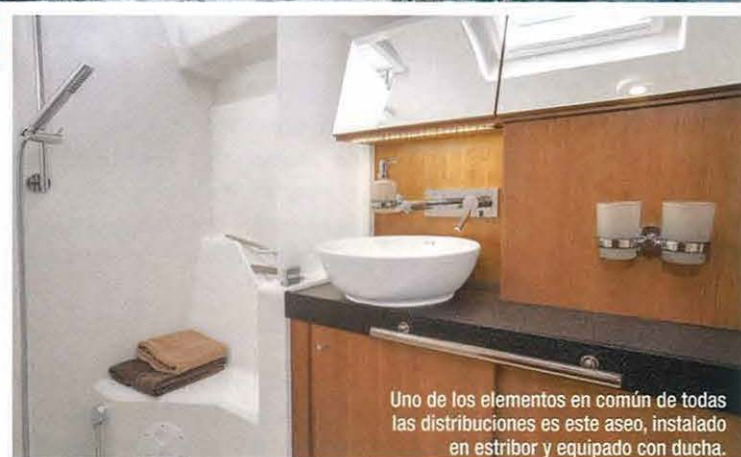
Uno de los elementos en común de todas las distribuciones es este aseo, instalado en estribor y equipado con ducha.

El Easy Sailing Concept de la firma, en esta caso, apuesta por el