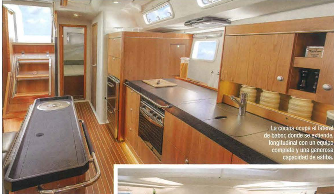
La cocina ocupa el lateral de babor, donde se extiende longitudinal con un equipo completo y una generosa capacidad de estiba.

Las variaciones afectan al resto de la distribución, que permite convertir, por ejemplo, el cofre de velas del extremo de proa en un camarote para la tripulación con acceso independiente. La estancia situada junto a ésta puede dedicarse