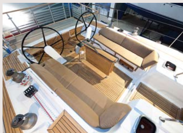
O poço é amplo e pouco profundo, mas muito confortável e seguro.