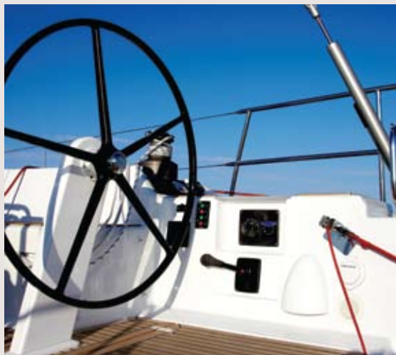
O posto de comando é espartano, mas muito funcional e ergonómico.