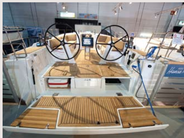
O espelho de popa é rebatível e dá acesso à balsa salva vidas.