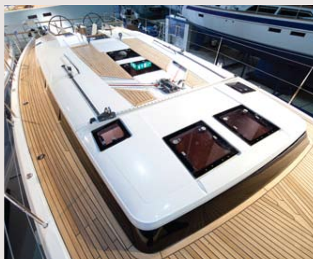
O "roof" é bastante plano, com grandes albos à face do deck.