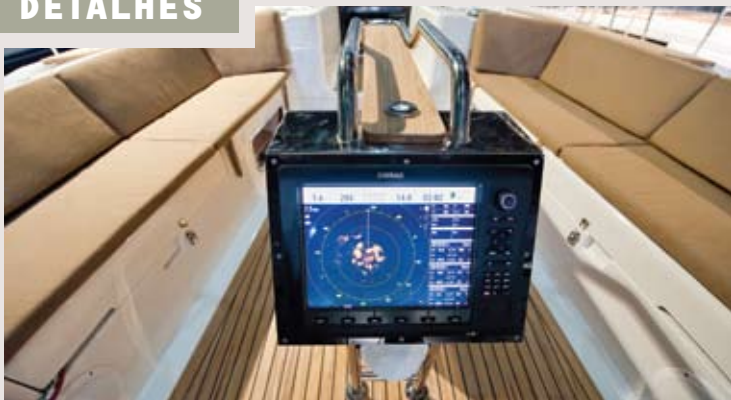
O poço é confortável. Na mesa central foi instalado uma grande chart ploter.