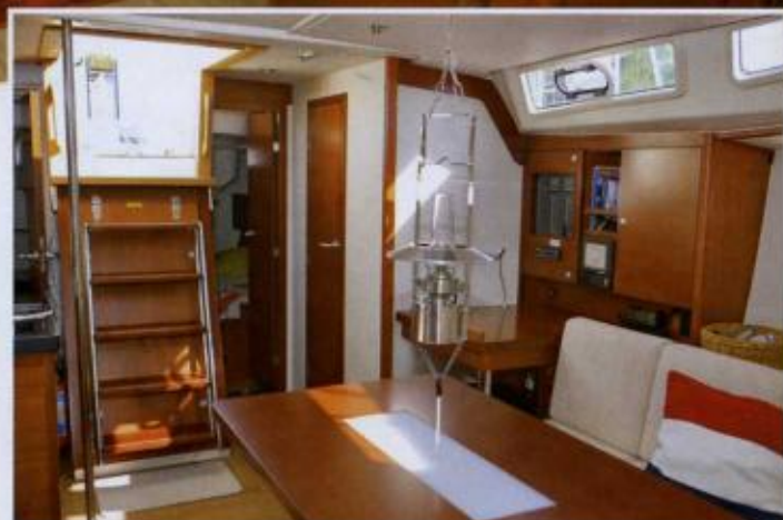
Ljusa väggar blandat med mahogny och rostfritt utmärker Hansebåtarna. Många fönster och luckor i tak och väggar släpper in mycket ljus.

finns det i mängd, fattas bara. Ändå har man inte tillvaratagit alla små utrymmen, vilket borde vara var båtkonstruktörs plikt. Ännu tydligare blir detta i sittbrunnen (se mer nedan).