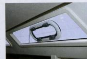
Det finns många fönster och ventiler på 470e. Här allt i ett.

båten innan det monteras på plats. Grabbräcken är något som verkar försvinna alltmer på moderna båtar. Det kan bero på att man inte längre seglar så mycket på havet utan bor i båten långa perioder i hamn. Icke förty borde grabbräcken finnas, särskilt på båtar som har CE märkningen A – oceangående. På 470e finns bara stängen vid pentryt och räcket runt pentrybänken att hålla sig. Det räcker inte när det lutar.