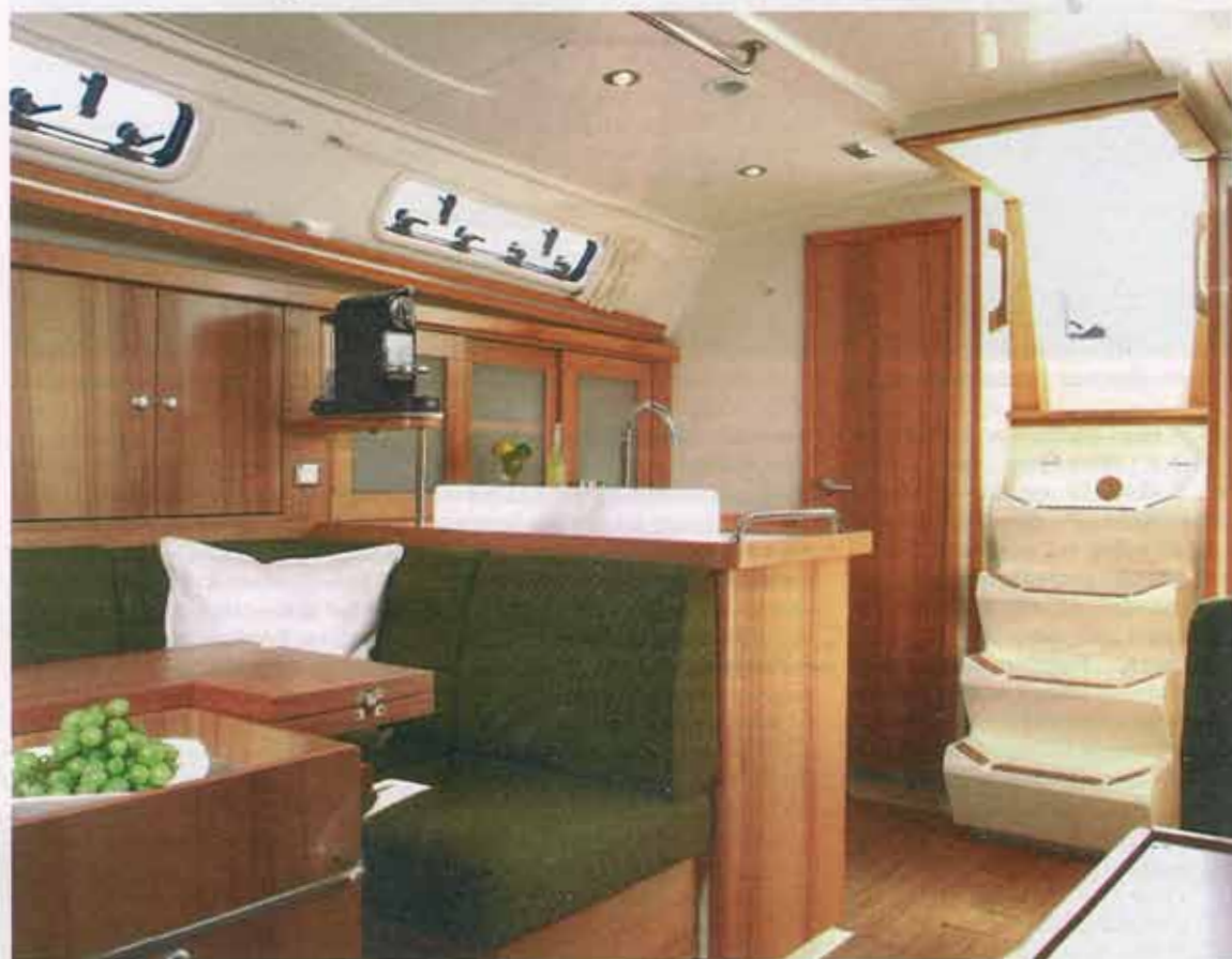
W salonie znajduje się rozkładany stół jadalny.

Kanapa przy dużym stole oraz fotele przy stole nawigacyjnym tworzą całość. Załoga może zasiąść do wspólnej kolacji i nie musi się znajdować blisko siebie, ramię w ramię na jednej burcie. Światło wpada do salonu przez boczne okna oraz przez dwa otwierane luki na suficie. Odpowiednią temperaturę i wentylację zapewnia urządzenie firmy Eberspächer.