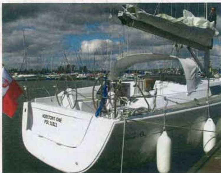
„Horyzont One” przy kei w Szczecinie.