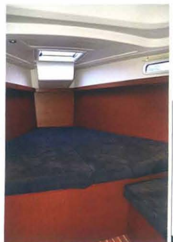
FORUT: To luker i dekk og vinduer i skroget gjør lugaren forut hyggelig.