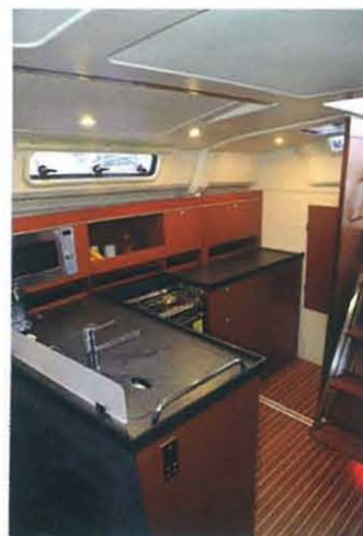
BYSS: Byssa er stor, og i to-lugarsversjonen enorm. Kjøleboksen er super.