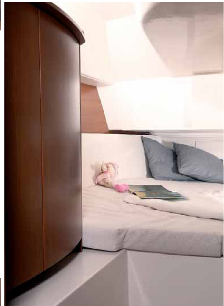
▲ Una segunda cabina, situada en popa, ampliará la capacidad de pernocta con dos plazas más gracias a su cama doble.

de varios armarios y estanterías, lo que reserva los extremos de la embarcación al área de pernocta. Ésta incluye dos camarotes equipados con cama doble, uno en proa y otro en popa estribor, situado junto a una estancia dedicada a la estiba de velas y otros accesorios. Todos los ocupantes podrán hacer uso del aseo instalado en babor, que incorpora un inodoro marino, lavabo y espejo, además de la posibilidad de contar con una ducha opcional para ampliar el confort a bordo.