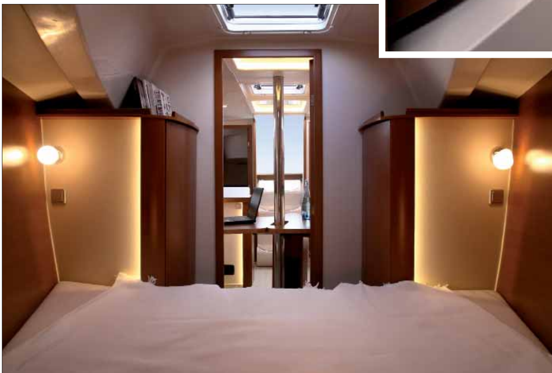
◀ El camarote de proa, con una distribución simétrica, incluye una cama doble y dos armarios guardarropa.