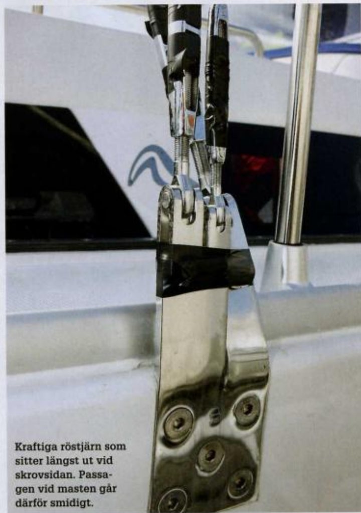
Kraftiga röstjärn som sitter längst ut vid skrovsidan. Passagen vid masten går därför smidigt.