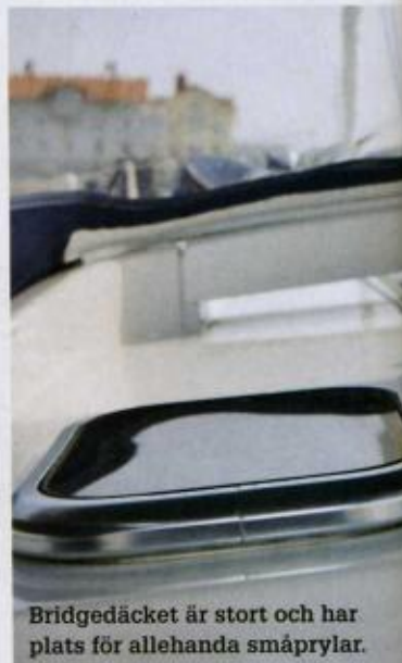
Bridgedäcket är stort och har plats för allehanda småprylar.

let för de cremefärgade (standard) som bilderna här visar.