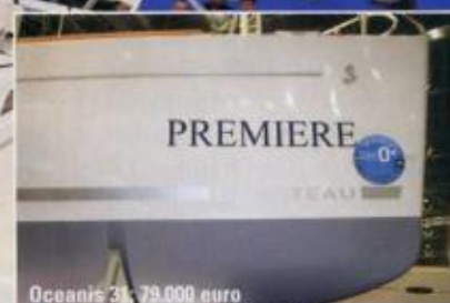
Oceanis 31: 79.000 euro