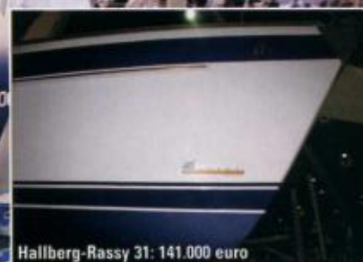
Hallberg-Rassy 31: 141.000 euro