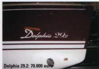
Delphia 29.2: 70.000 euro