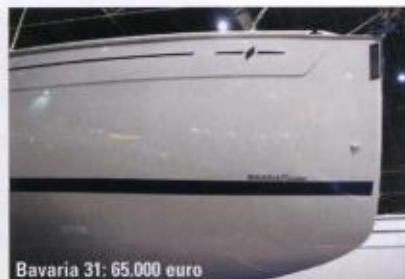
Bavaria 31: 65.000 euro

Vi gikk om bord blant alle folkene på messen, og stilte følgende spørsmål til utstillere: Hvorfor skal jeg velge denne båten? Vi gjør oppmerksom på at prisene i Tyskland nok er noe lavere enn i Norge, fordi merverdiavgiften kun er 19 prosent sammenlignet med 25 prosent her i landet. Norske priser kan du sjekke på www.batguiden.no eller ved å kontakte forhandleren i Norge. Alle de omtalte båtene har norsk forhandler.