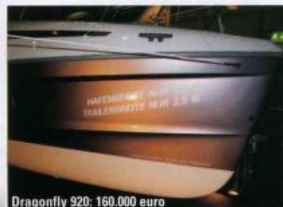
Dragonfly 920: 160.000 euro