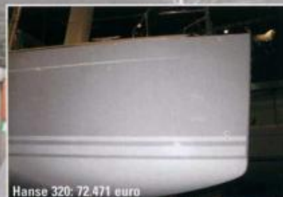
Hanse 320: 72.471 euro