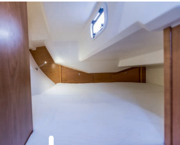
De kooi in de achterhut is dwarsgeplaatst. Behoorlijk groot, maar onder helling niet comfortabel.

Niet ambachtelijk, dat mag je in deze prijsklasse ook niet verwachten. Wel een pienter gebruik van de ruimte.