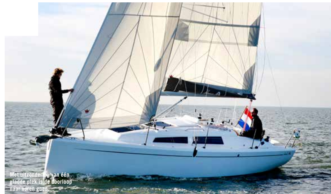
Met uitzondering van één gladder plek is de doorloop naar voren goed.

meer wind blijft, is niet duidelijk. Op 35 graden aan de wind varen we 5,2 knopen, een mooie prestatie voor een toerjacht bij deze windkracht. Zeker als je bedenkt dat er vijf ton aan comfort door het water moet worden getrokken. Sturen we hoger dan 35 graden, dan scheidt de boot ermee uit. Afvallen is zo gedaan (met een helmstok voelt de draaicirkel automatisch kleiner) en tot halve wind blijft de snelheid constant 5,3 knopen. Lager houdt de keerfok het voor gezien, zoals verwacht, maar het scheelt slechts 0,7 knoop in snelheid.