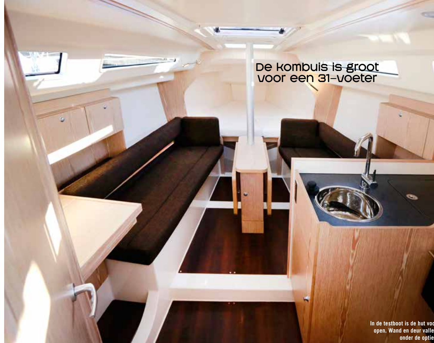
De kombuis is groot voor een 31-voeter

We zeilen de Hanse met licht weer op een verlaten IJsselmeer. De testboot is uitgerust met de diepe kiel (1,85 meter) en voelt dan ook stabiel aan. Zoals gebruikelijk heeft de Hanse 315 een keerfok. Dat 'ontzorgt', zoals men dat noemt, maar levert ook minder trimmogelijkheden op. Tegelijkertijd maakt een keerfok het enorm gemakkelijk om de boot in je eentje te zeilen. Manoeuvres worden een peulenschil als je niets meer aan de fokkeschoot hoeft te verstellen. Voor de koersen lager dan halve wind is een gennaker of een Code 0 aan te raden. Aan de wind merken we bij een ware wind van acht knopen een lichte loefgierigheid op, die we er moeilijk uit kunnen trimmen. Of die loefgierigheid bij