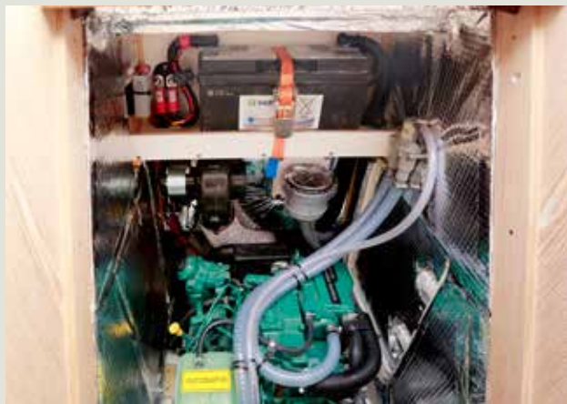
De startaccu is hoog en droog boven de motor geplaatst.