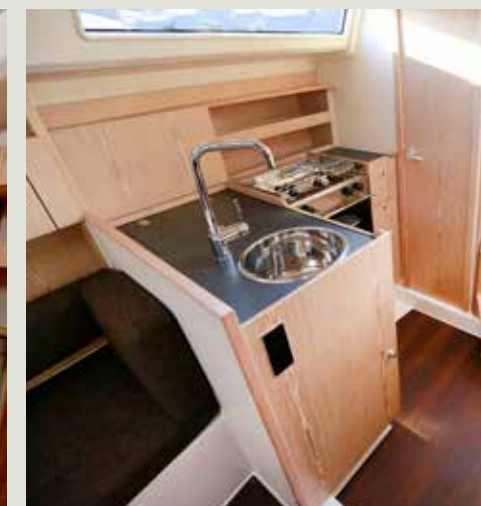
Scherpe hoeken: niet geschikt voor zeegang.