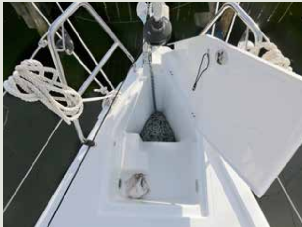
Ankerbak met een uiterst degelijke deksel.