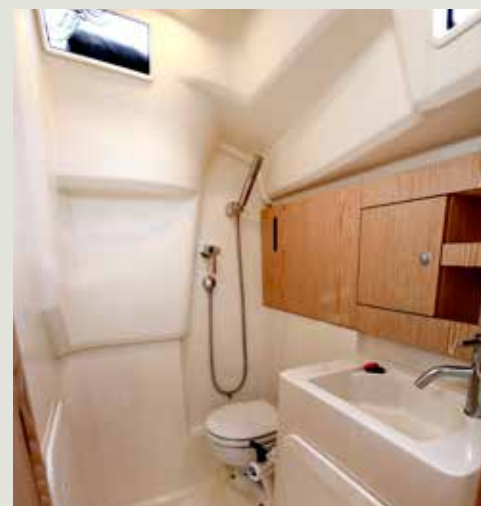
Toiletruimte met handdouche en grote wastafel.