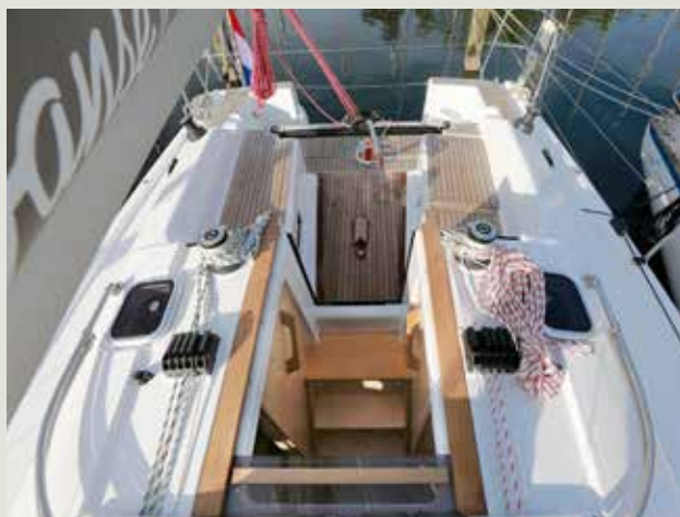
Alle lijnen zijn naar de kuip geleid.