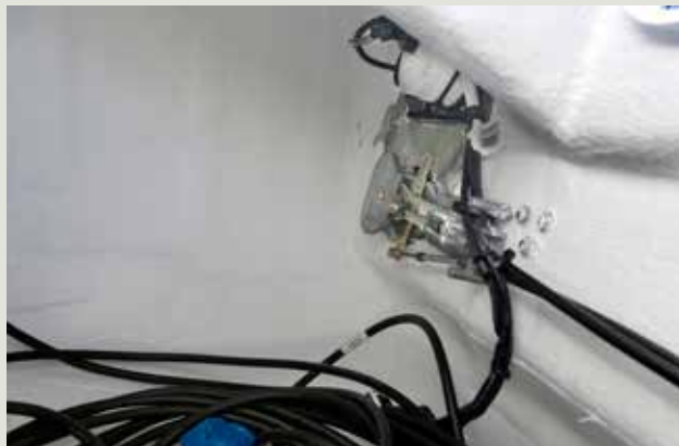
Morsekabels van de motorbediening in de bakskist zijn niet afgedekt.