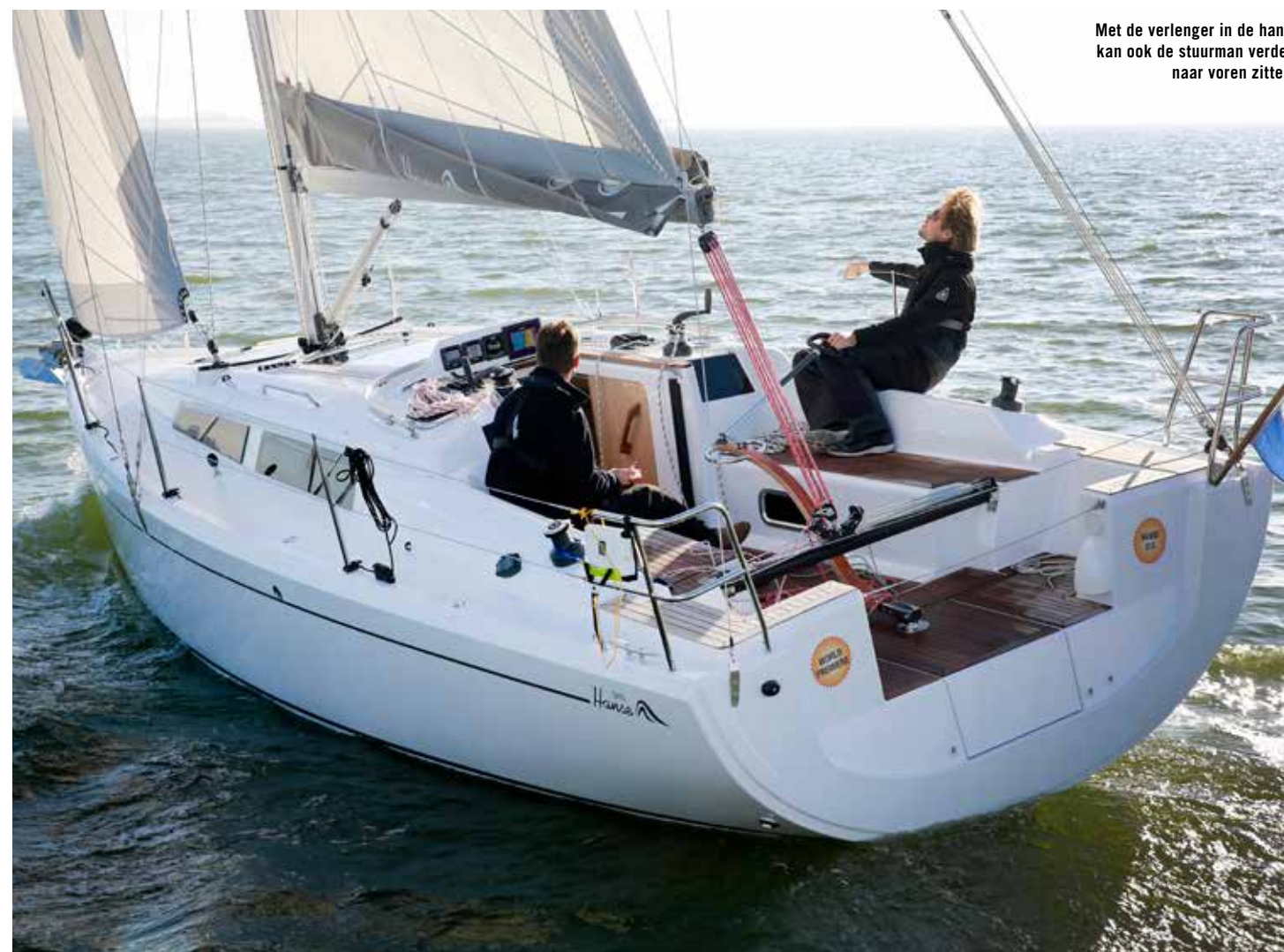
Met de verlenger in de hand kan ook de stuurman verder naar voren zitten.