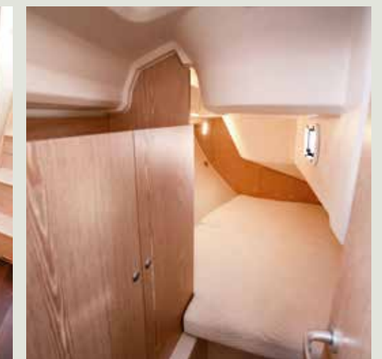
Groot bed achter van 2,00 x 1,70 meter.