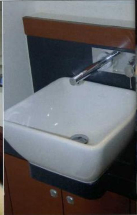
PÅ FÖRLAGET GÖR VI ÄVEN heminredningstidningen Residence . De skulle mycket väl kunna göra ett reportage ombord. Handfatet är från badrummet. Detaljer är viktiga.