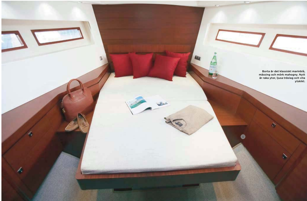
Borta är det klassiskt marinblå, mässing och mörk mahogny. Nytt är raka ytor, ljusa träslag och vita ytskikt.