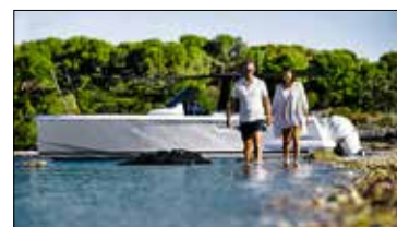
Beacher ou mouiller dans 20 cm d'eau : l'atout maître du 36 Open.