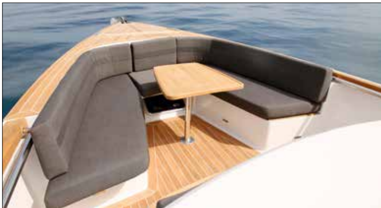
La plage avant est occupée par un confortable carré en U encadrant une seconde table.