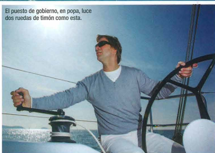
El puesto de gobierno, en popa, luce dos ruedas de timón como esta.

Las posibilidades se amplían con la oferta de tres calados diferen-