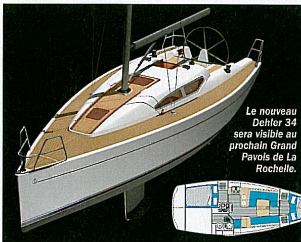
Le nouveau Dehler 34 sera visible au prochain Grand Pavois de La Rochelle.

Dans la droite ligne du Dehler 44 sorti l'an passé, et qui restera comme le symbole du changement de cap initié par le chantier depuis sa reprise en 2004 par Wilan Van den Berg, voici deux nouveautés qui feront l'actualité du chantier cette année : le majestueux Dehler 60 qui sera présenté à flot au Salon de Gênes et le Dehler 34 au Grand Pavois de La Rochelle. Dessiné lui aussi par le tandem Simonis-Voogd, il présente une carène assez étroite de flottaison et dont les appendices sont optimisés pour la régate. Les premières vues laissent présager un mélange d'élégance et de technicité très réussi, à l'image de l'insert central en teck sur le rouf pourvu de capots flush. Le reste est on ne peut plus classique, à l'image du cockpit ou de l'agencement habillé de teck et proposé exclusivement en deux cabines. Ce Dehler 34 vise le même segment de clientèle que le X-34 (VV n° 432). Il a pour lui un prix d'appel assez attractif au regard de ses prestations, mais devra aussi faire ses preuves sur les plans d'eau de régate pour exister dans ce créneau très disputé. P.M.B. Longueur : 10,51 m. Largeur : 3,49 m. Tirant d'eau : 1,95 m. Poids : 5,11 t. Voilure : 75,40 m 2 . Prix : 119 480 euros. Chantier : Dehler. www.dehler.com . Importateur : Couleurs Yachting, 02.97.66.02.10.