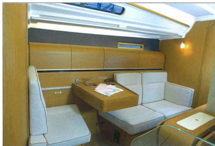
La mesa de cartas deslizante crea diferentes configuraciones en combinación con el sofá longitudinal de babor.

La proa se ha dedicado a un camarote doble, mientras que para la popa se permite elegir entre una o dos cabinas, ambas con una cama doble. El lateral de babor, pues, podrá dotarse de una amplia estancia de estiba que comunicará directamente con el aseo del modelo, de gran versatilidad. Esta se consigue mediante la instalación de una puerta encargada de separar el salón del espacio, o bien dar intimidad al inodoro y la ducha para dar acceso a los camarotes de popa.