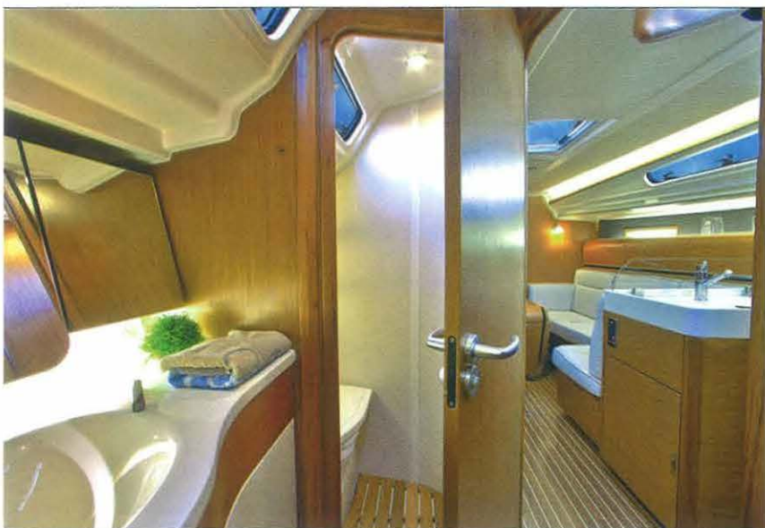
El modelo se dota de una versátil puerta que permite separar el inodoro del resto del aseo o bien el salón de las estancias de popa.