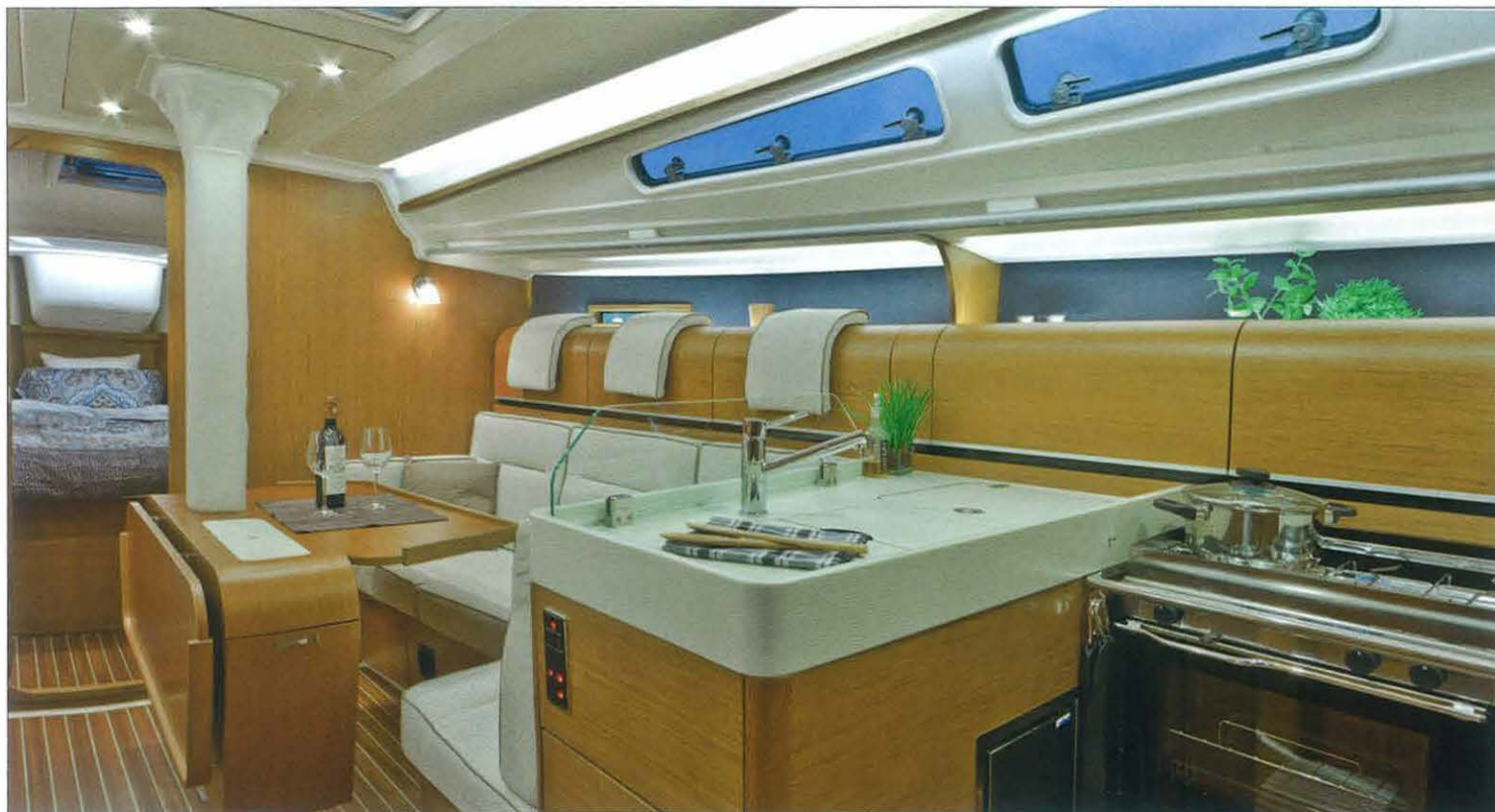
La cocina, en estribor, adopta forma de L y se abre a la distribución del salón.