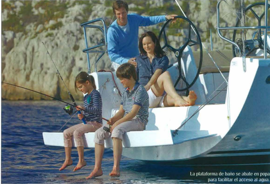
La plataforma de baño se abate en popa para facilitar el acceso al agua.

tes, basándose el estándar en una quilla en T de hierro fundido de 2 metros y una relación con el desplazamiento del 32%. Los otros dos consisten en uno de corto en L de hierro fundido de 1,60 metros y con un lastre de 2.550 kg y otro, orientado a la competición, que combina el hierro y el plomo fundidos en una quilla en T de 2,20 metros y un lastre de 1.900 kg.