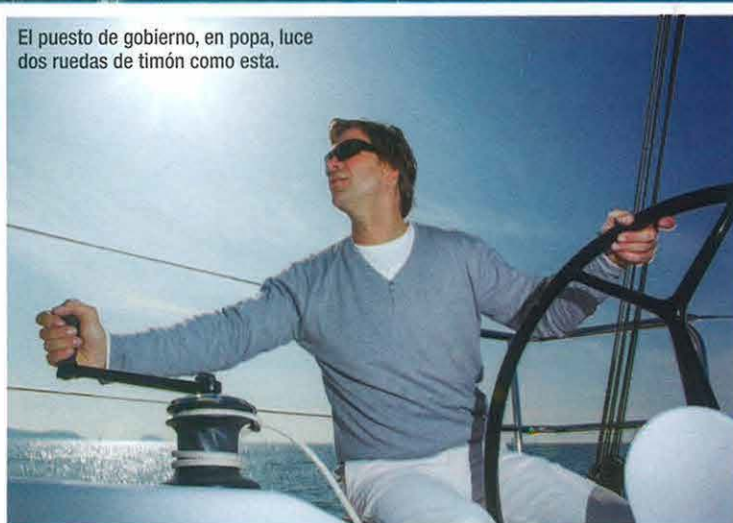
El puesto de gobierno, en popa, luce dos ruedas de timón como esta.

Las posibilidades se amplían con la oferta de tres calados diferen-